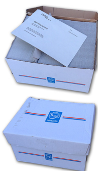
Couverts ohne Fenster in Schachteln: