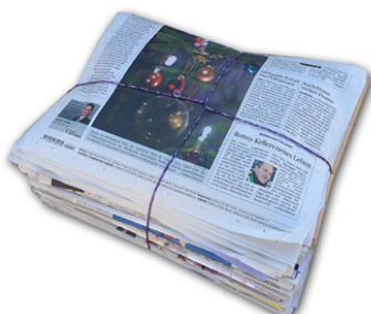
Zeitungen / Papier gebündelt