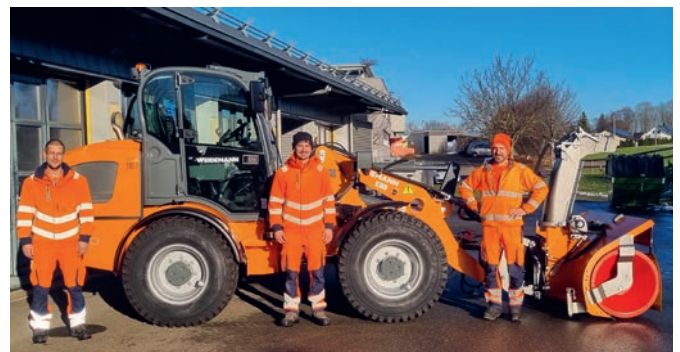
Das Team des Unterhaltsdienstes freut sich über das neue Fahrzeug.

Seit letzter Woche ist im Werkhof der Gemeinde Oberuzwil ein neues Fahrzeug im Einsatz. Der mittlerweile 25-jährige Hubstapler wurde durch einen Pneu-lader ersetzt.