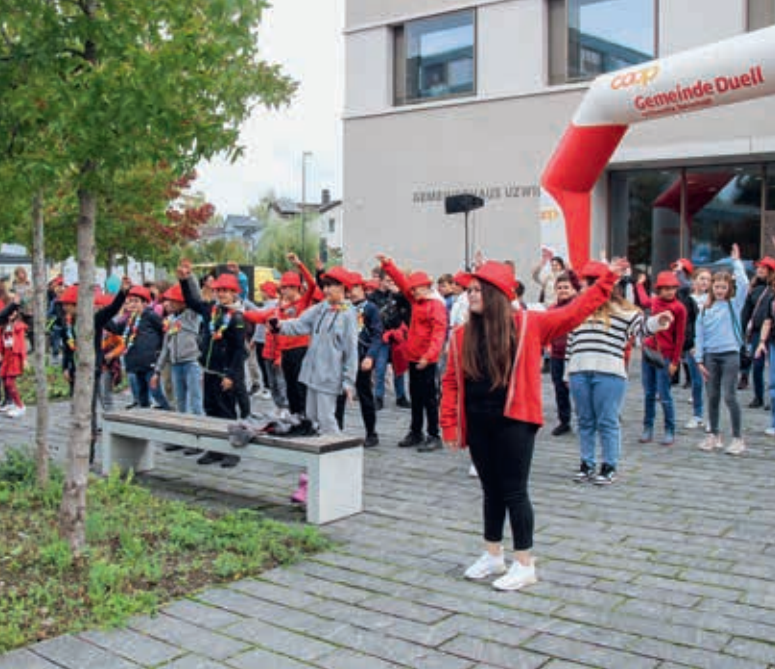
Den Auftakt zu «oberUZWIL bewegt Mai 2023» gab der Bewegungstanz am Uzwiler Herbstmarkt mit vielen Schülerinnen und Schülern und dem Projektteam.