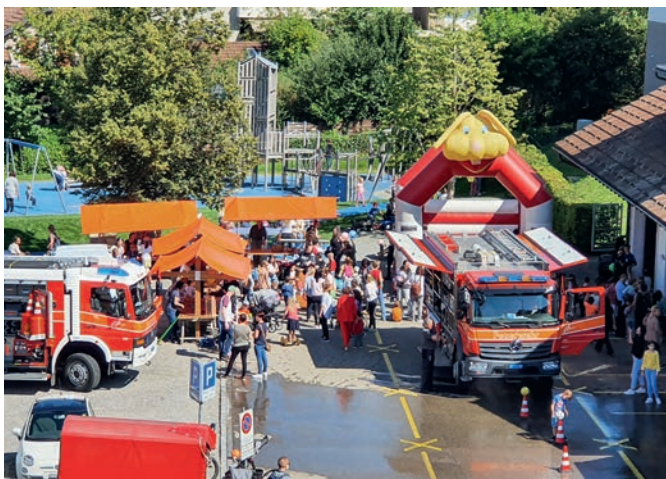
Impressionen vom Spielplatzfest 2022

Die Organisatoren haben Sonnenschein bestellt und hoffen auf gute Wetterbedingungen. Bei schlechtem Wetter müsste auf die Durchführung des Oberuzwiler Spielplatzfestes verzichtet werden. Im Zweifelsfall erteilt die Bauverwaltung unter Telefon 071 950 48 55 gerne Auskunft.