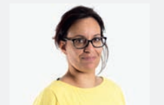
Ich mache Älteren Freude und mir auch.