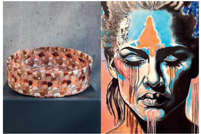
VEREIN GALERIE AM GLEIS

Wenn Sie feststellen, dass ihr Alkoholkonsum negative Auswirkungen auf Ihr Leben hat (z.B. Probleme in Beziehungen, am Arbeitsplatz oder mit der Gesundheit erzeugt) ist es wichtig, Unterstützung in Anspruch zu nehmen. Sie sind mit diesem Problem nicht allein. Für weitere Informationen im Umgang mit Alkohol steht Ihnen die Suchtberatung der Sozialen Dienste in Oberuzwil zur Verfügung (071 950 48 95 / suchtberatung@oberuzwil.ch). Melden Sie sich ganz unverbindlich bei uns.