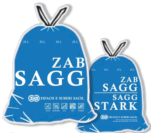
Von grau zu blau – neuer ZAB-Sagg

Die neuen Kehrichtgebührensäcke, welche im April auf den Markt kommen werden, sind gleich teuer wie die alten, aber nachhaltiger. Mit einem Anteil von über 80 Prozent Recyclingmaterial sind sie wesentlich umweltfreundlicher. Das Material für die Kehrichtsäcke wird aus dem Recycling von Kunststoffabfallprodukten von Industrie und Grossverteilern wiedergewonnen. Dadurch werden zur Produktion der Kehrichtsäcke weniger primäre Rohstoffe benötigt. Damit werden die CO 2 Emissionen spürbar gesenkt.