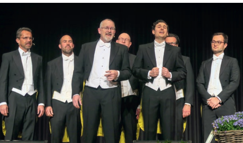
The Singing Pinguins

Verschiedene Faktoren hatten das Bankgeschäft 2023 negativ beeinflusst. Der innert kurzer Zeit passierte Untergang der CS-Holding hat einen riesigen Reputationsschaden verursacht. Aber auch der Krieg in der Ukraine sorgte für Verunsicherung, ebenso