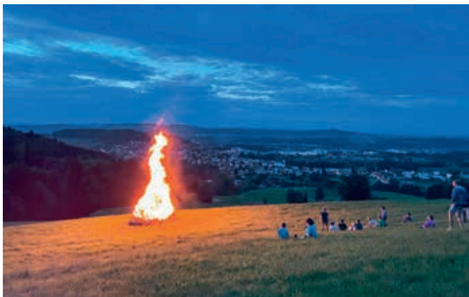
Bundesfeier 2023 auf dem Eppenbergr in Bichwil

Gemeinderat und Kulturkommission freuen sich, dass die Bundesfeier am Mittwoch, 31. Juli 2024, auf der Wiese in Niederglatt stattfinden wird. Die Organisation des Anlasses übernimmt das freiwillige Rettungscorps Oberuzwil. Musikalisch umrahmt wird der Anlass von der Musikgesellschaft Bichwil-Oberuzwil. Sichern Sie sich bereits jetzt die beiden Daten. Weitere Informationen folgen.