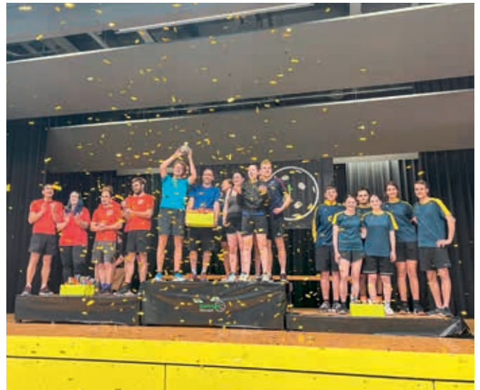
OK SPORTNIGHT OBERUZWIL