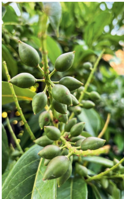
Die unreifen Beeren des Kirschlorbeers können im Neophytensack entsorgt werden.