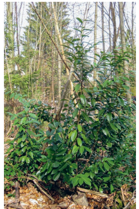
Der Kirschlorbeer verbreitet sich in Wäldern und behindert die natürliche Verjüngung.