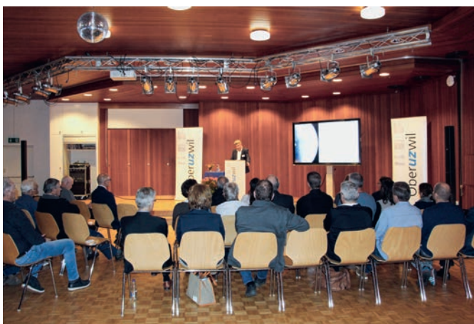
Impressionen vom vergangenen Jahr