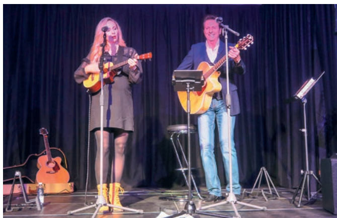
Das Duo Katzman liess die Herzen des Gerbi-Publikums höherschlagen.

Mehr dazu kann auf kulturnotizen.ch nachgelesen werden.