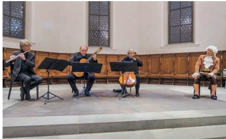
Das Edes-Ensemble spielte hoch konzentriert und virtuos.